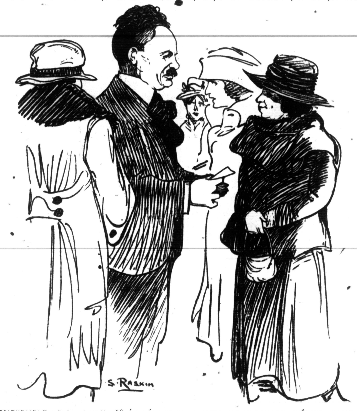
אין אַרלינגמאַן האַל.

כאניום, האָבען מיר געשריבען א פּאָר ווערטער וועגען אייניגע פון יענע קאָמי־ מיר האָבען גאָך אָבער אַלץ ניט געשריבען ּוועגען אַלע יענע קאָמיטעס. און יעדער איין קאמיטע באַזונדער וואָס שטעלם צוואמען די גרויסע דושענעראל [